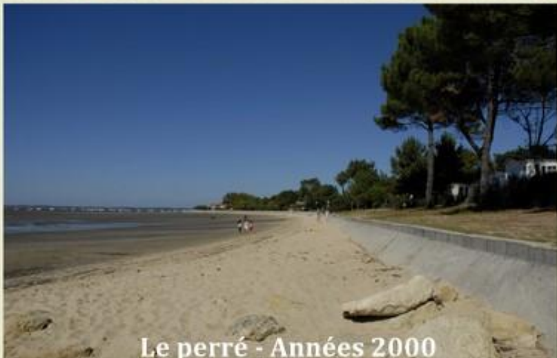
Le perré - Années 2000