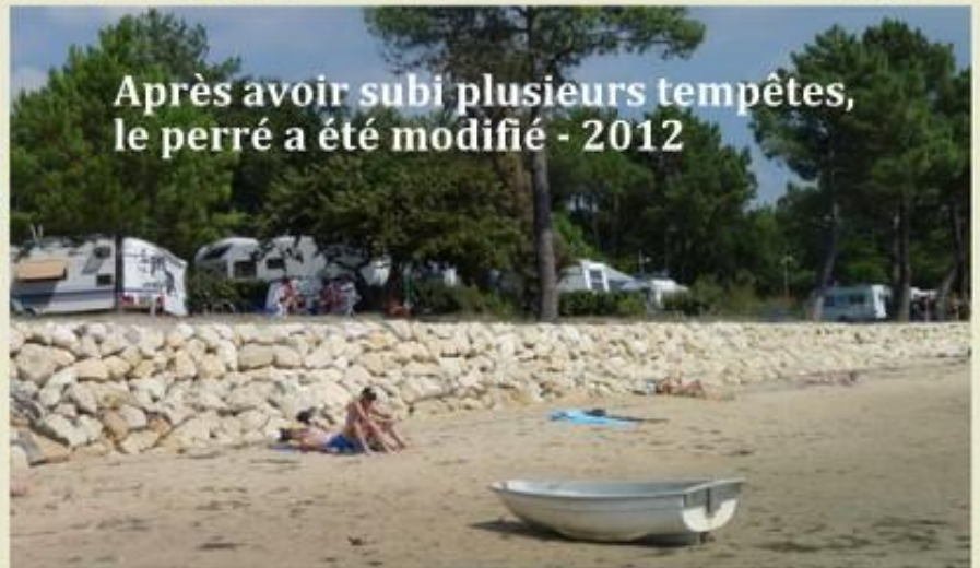
Après avoir subi plusieurs tempêtes, le perré a été modifié - 2012