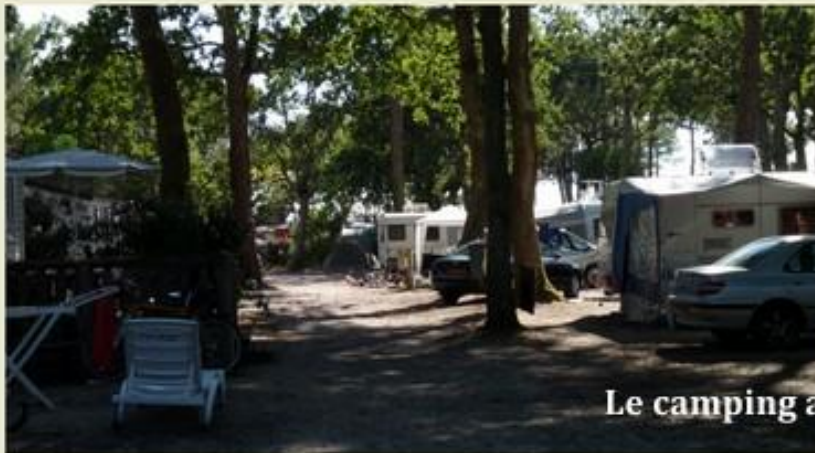
Le camping aujourd'hui - 2011