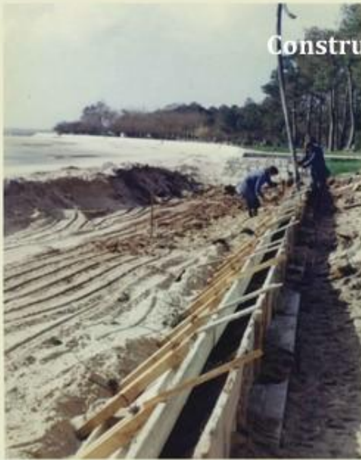
Construction du perré - 1977