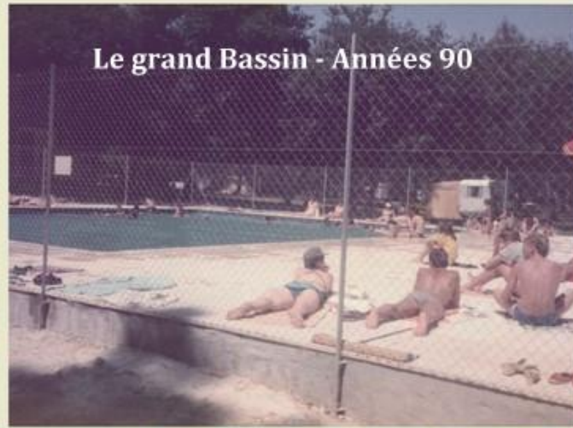
Le grand Bassin - Années 90