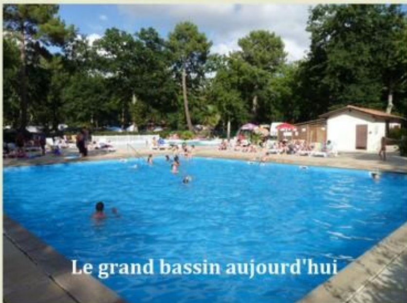
Le grand bassin aujourd'hui