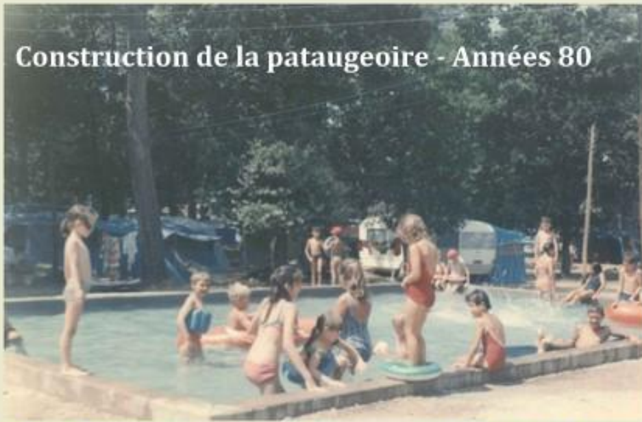
Construction de la pataugeoire - Années 80